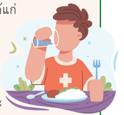
ขอบคุณที่มา : กรมควบคุมโรค

กลุ่มที่ 4 ภัยสุขภาพ การเสียชีวิตที่เกี่ยวข้องจากภาวะอากาศหนาว โดยไม่ทราบสาเหตุ ส่วนใหญ่เกิดจากภาวะหัวใจล้มเหลวเฉียบพลัน เนื่องจากไม่มีเครื่องนุ่งห่มหรือเครื่องห่มกันหนาวที่เพียงพอในพื้นที่อากาศหนาว และมีประวัติการดื่มสุราเป็นประจำ ดังนั้นควรเตรียมเครื่องนุ่งห่มกันหนาวให้พร้อมและเพียงพอ และงดการดื่มเครื่องดื่มแอลกอฮอล์ พร้อมทั้งดูแลสุขภาพให้แข็งแรง ออกกำลังกายและรับประทานอาหารที่มีประโยชน์